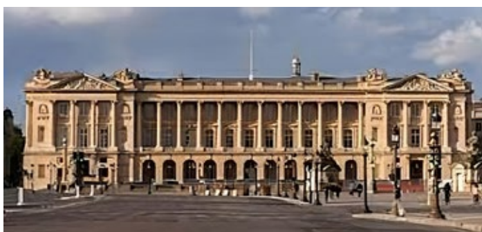
Hôtel de la Marine